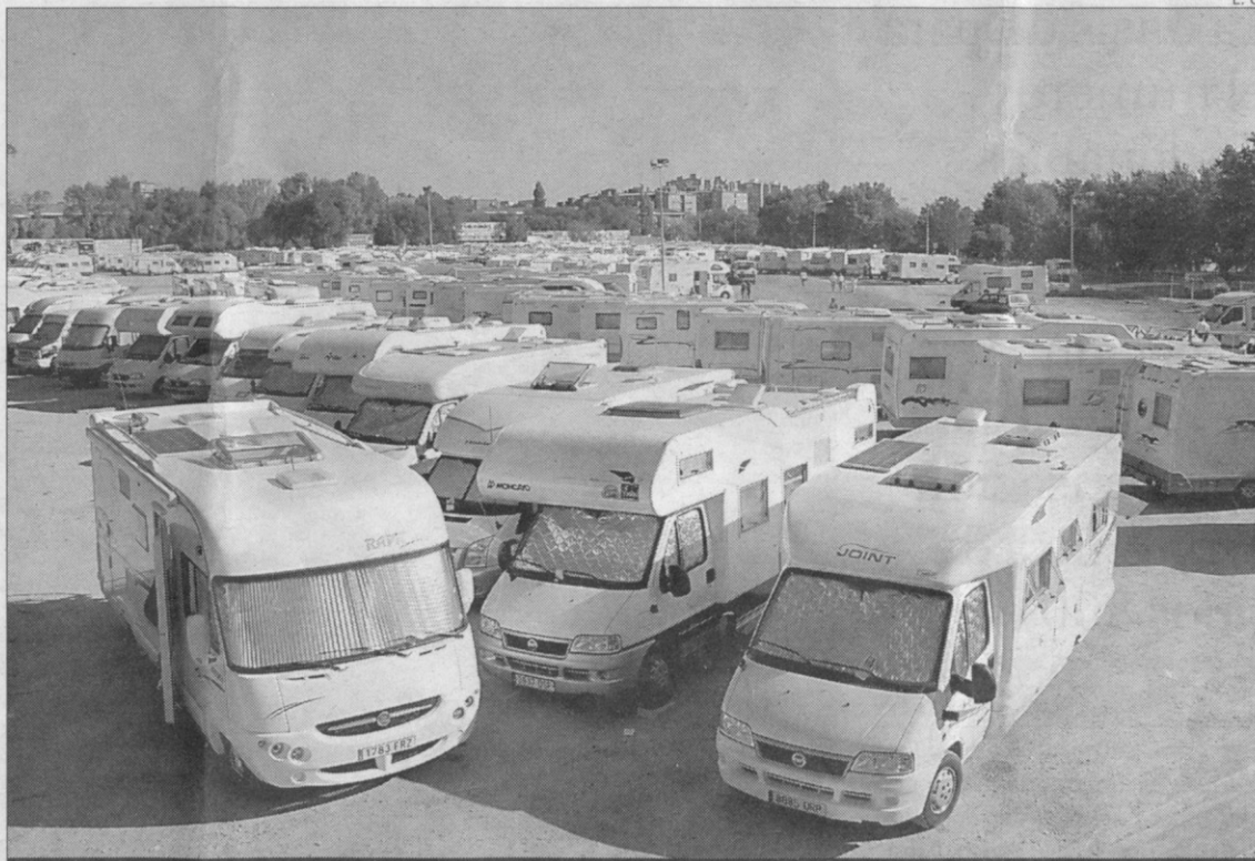
Concentración de autocaravanas en la Región de Murcia, donde se calcula que hay unas trescientas