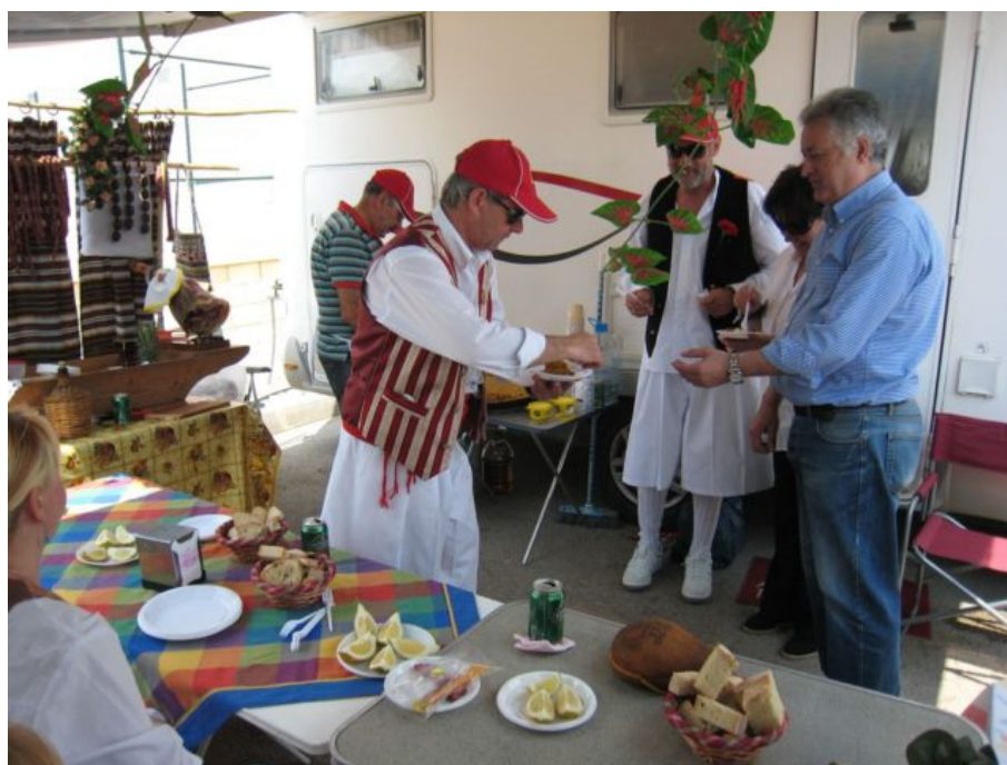
Vistas en miniatura